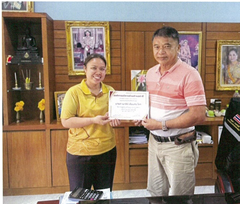
ภาพมอบเกียรติบัตรโครงการยกย่องผู้มีคุณธรรม จริยธรรมในการปฏิบัติราชการและให้บริการประชาชนดีเด่น ประจำปีงบประมาณ ๒๕๖๗